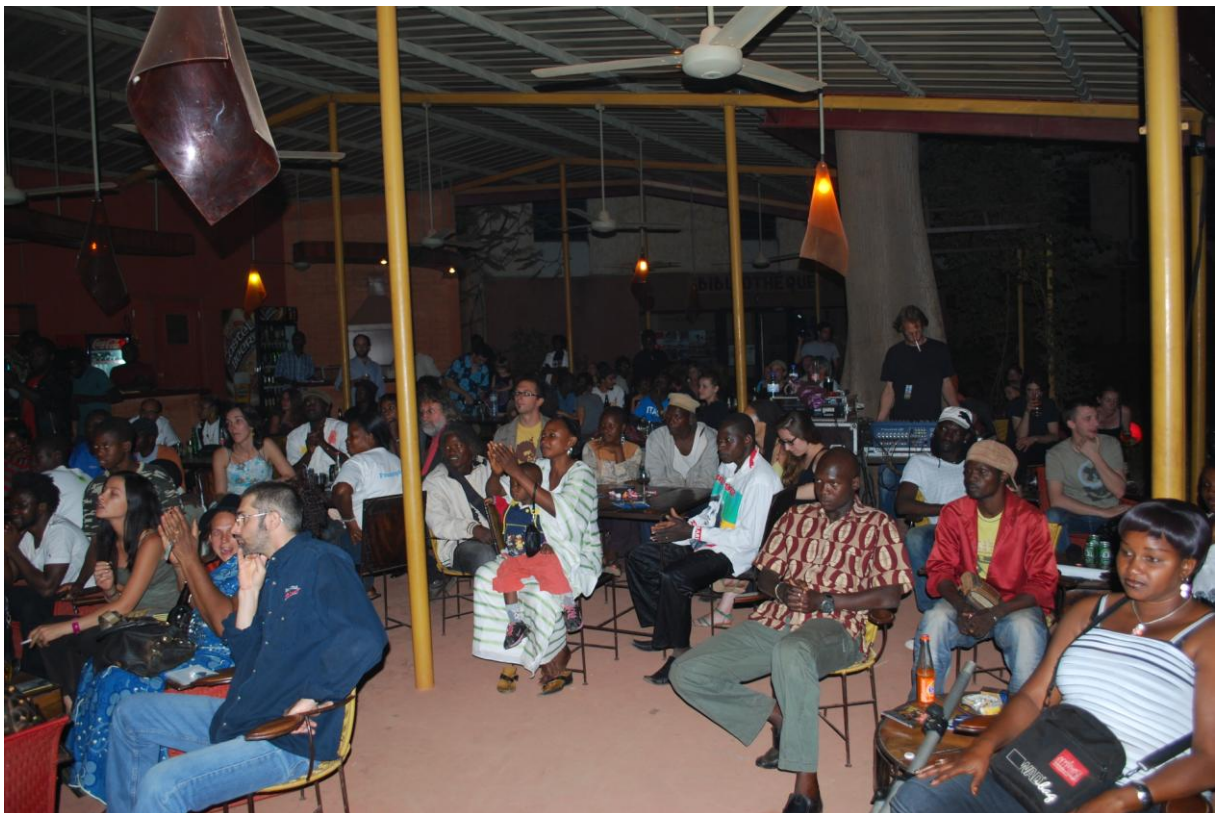
PUBLIC CAFE CONCERT

Nombreuses sont les structures de production qui n'ont pas pu prendre part à cette 3 e édition de SagaMusik. Cela est dû au fait qu'elles ne bénéficient pas d'assez de moyens pour confectionner des éléments de promotion, même si la tenue de la Semaine Nationale de la Culture de Bobo-Dioulasso, à la même période, y a été pour une part importante. Aussi, la majorité de ces structures reposent-elles sur un seul individu qui est amené à effectuer de fréquents déplacements à l'étranger, ce qui ne lui permet pas de réaliser d'activités régulières. Malgré cet état des choses, elles ne s'en sont pas montrées moins intéressées.